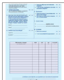
Questionnaire d'anesthésie complété (liste médicaments)

Veillez-vous munir de tout support permettant un relevé le plus complet possible de votre médication :